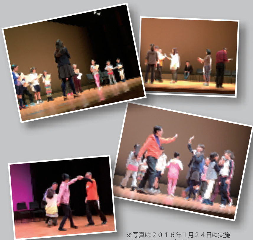
※写真は2016年1月24日に実施したワークショップの様子。